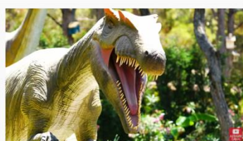
BARULHO DE DINOSSAURO, SONS de DINOSSAUROS

E ESTIMULE A CRIANÇA A REPRODUZIR O SOM GRAVE IMITADO PELO DINOSSAURO IGUAL O VÍDEO.