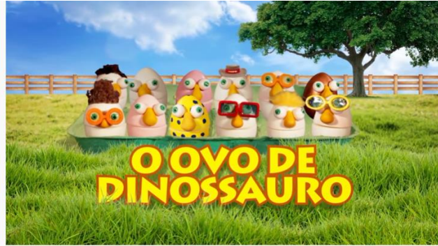
Amigovos - Ovo de Dinossauro